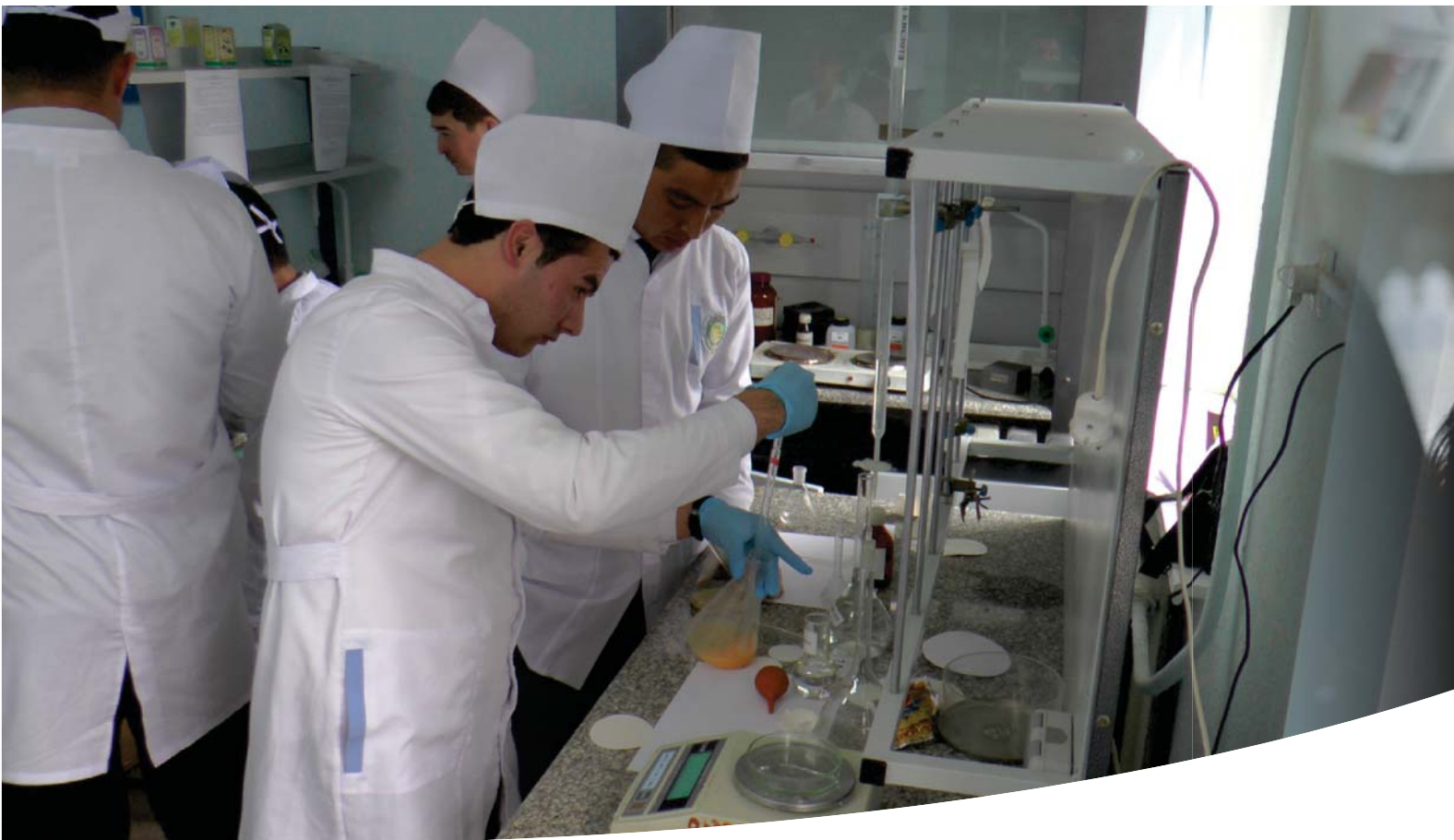
Махсус кафедралардаги амалий машғулотлар фармацевтика корхоналари, ўқув-илмий ишлаб чиқариш марказлари ва ўқув-илмий тажриба лабораторияларида олиб борилмоқда.